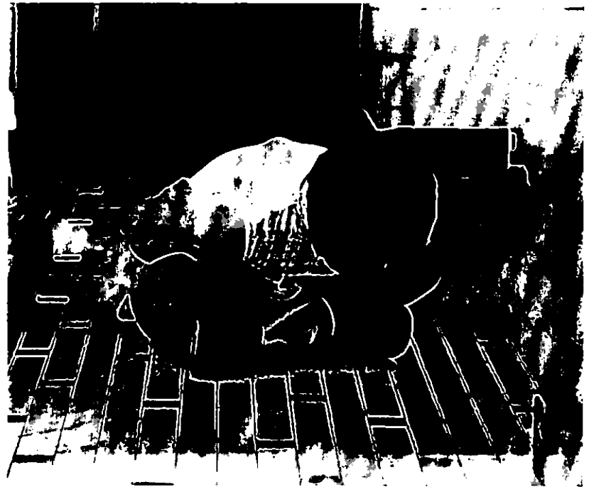
La Raison du plus fou (Daniel Karlin).

La menace s'instaure et s'incarne dans la personne de cet autre, tellement réversible avec celui qui occupe la place de téléspectateur que le glissement imperceptible qui pourrait faire passer le dernier dans la position du premier est proprement intoléra-